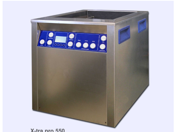
X-tra pro 550

Appareil de nettoyage aux ultrasons, robuste et puissant, destiné aux applications dans l'industrie. L'appareil est équipé de différents raccords permettant la connexion aux appareils périphériques (ex. unité pompe-filtre, séparateur d'huile), ainsi qu'à une commande externe (SPS/PC). L'aisance de manipulation est assurée par la présence de touches et d'un affichage sur écran. Les appareils de la série X-tra pro sont disponibles en 5 tailles (300, 550, 800, 1200 et 1600).