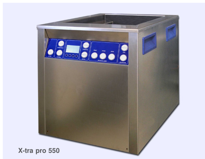
X-tra pro 550

Appareil de nettoyage aux ultrasons, robuste et puissant, destiné aux applications dans l'industrie. L'appareil est équipé de différents raccords permettant la connexion aux appareils périphériques (ex. unité pompe-filtre, séparateur d'huile), ainsi qu'à une commande externe (SPS/PC). L'aisance de manipulation est assurée par la présence de touches et d'un affichage sur écran. Les appareils de la série X-tra pro sont disponibles en 5 tailles (300, 550, 800, 1200 et 1600).