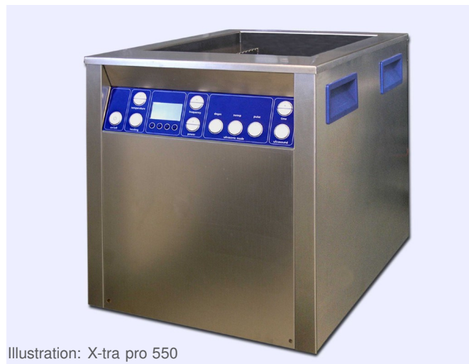
Illustration: X-tra pro 550

Appareil de nettoyage aux ultrasons, robuste et puissant, destiné aux applications dans l'industrie. L'appareil est équipé de différents raccords permettant la connexion aux appareils périphériques (ex. unité pompe-filtre, séparateur d'huile), ainsi qu'à une commande externe (SPS/PC). L'aisance de manipulation est assurée par la présence de touches et d'un affichage sur écran. Les appareils de la série X-tra pro sont disponibles en 5 tailles (300, 550, 800, 1200 et 1600).